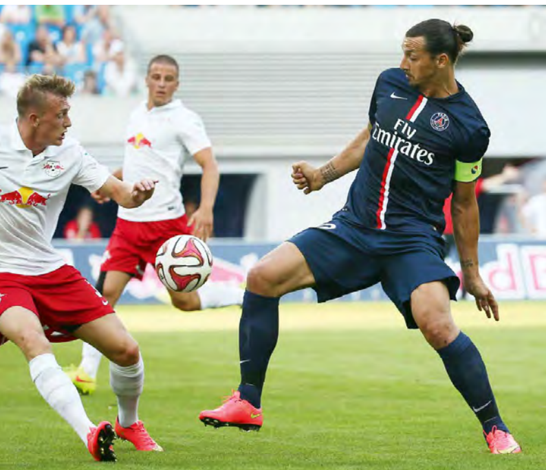
Zlatan Ibrahimović beim Testspiel von Paris Saint-Germain gegen RB Leipzig am 18. Juli 2014.

Es gibt weitere Überlieferungen, die das Selbstverständnis des Unbeschreiblichen beschreiben. Als Ibrakadabra zusammen mit Lionel Messi in Barcelona spielte, sagte er mit Blick auf den verkniffenen Taktiker Pep Guardiola: „Wir brauchen den Philosophen nicht, der Zwerg und ich reichen vollkommen.“