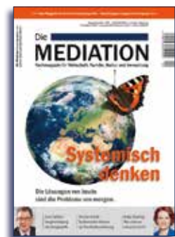
Ausgabe IV | 2017