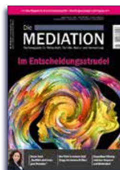
Ausgabe II | 2018