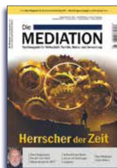
Ausgabe III | 2018