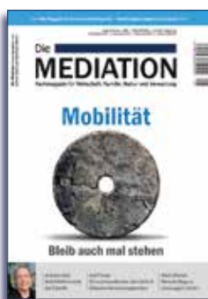
Ausgabe I | 2018