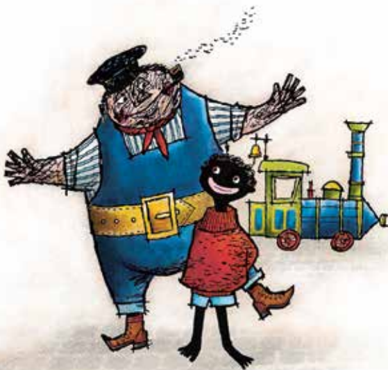
Abb. 1: Jim und Lukas.

Jim Knopf und Lukas der Lokomotivführer von Michael Ende erschien 1960 im Thienemann Verlag Stuttgart – zuvor war es von zwölf Verlagen abgelehnt worden. Zwei Jahre später kam der Folgeband Jim Knopf und die wilde 13 heraus. Beide Bücher zählen zu den erfolgreichsten deutschsprachigen Kinderbüchern. Sie wurden mit zahlreichen Buchpreisen ausgezeichnet und vielfach verfilmt, unter anderem von der Augsburger Puppenkiste (1960/61) und vom Regisseur Dennis Gansel (2018).