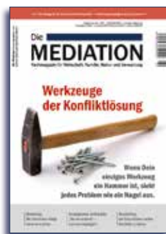
Ausgabe II | 2017