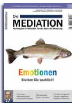
Ausgabe III | 2017