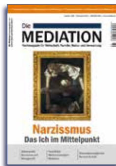
Ausgabe 2 | 2016