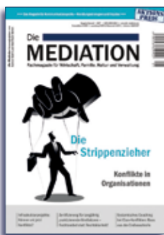
Ausgabe I | 2017