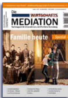
Ausgabe 4 | 2015 | nur noch als E-Paper

Als Mitglied des Bundesverbandes Steinbeis-Mediationsforum e. V. erhalten Sie die Print-Ausgaben „Die Mediation“ kostenfrei. Informationen über die Mitgliedschaft finden Sie unter: www.steinbeis-mediationsforum.de