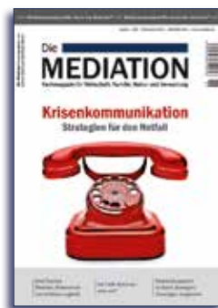
Ausgabe 1 | 2016