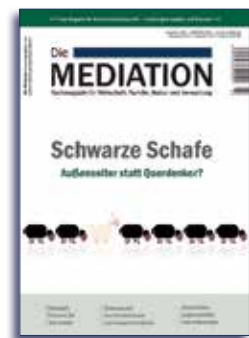
Ausgabe 3 | 2016 | nur noch als E-Paper