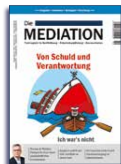
Ausgabe IV | 2018