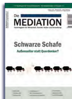
Ausgabe 3 | 2016