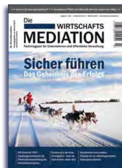
Ausgabe 3 | 2015