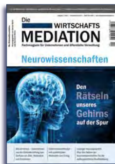
Ausgabe 2 | 2015