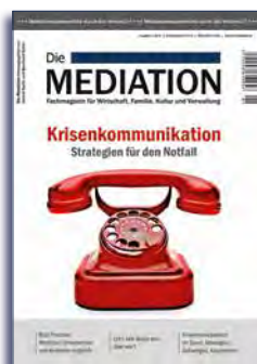
Ausgabe 1 | 2016