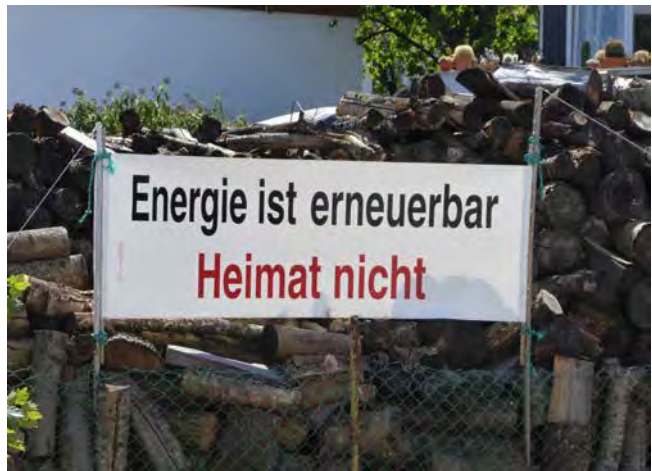
Abb. 1: Die Aktualisierung des Heimatgedankens im Protest gegen den Ausbau erneuerbarer Energien (wobei das Banner in seinem räumlichen Kontext durchaus einer gewissen Ironie nicht entbehrt, denn das dahinter gelagerte Brennholz ist ebenfalls den regenerativen Energien zuzurechnen; Foto: Olaf Kühne 2016).

Quelle: Chirchir, Habiba et al. (2015): Recent Origin of Low Trabecular Bone Density in Modern Humans. Proceedings of the National Academy of Sciences of the United States of America (PNAS) 112 (2), S. 366–371.