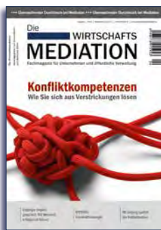
Ausgabe 4 | 2014