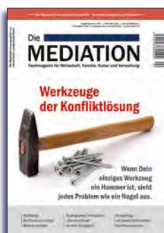
Ausgabe II | 2017