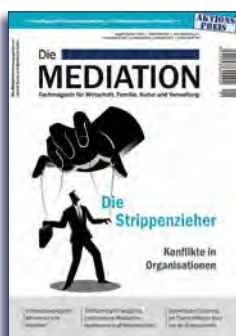
Ausgabe I | 2017