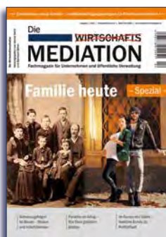
Ausgabe 4 | 2015