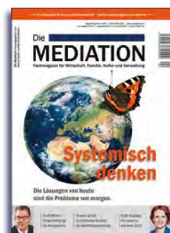
Ausgabe IV | 2017