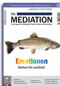
Ausgabe III | 2017