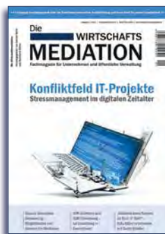
Ausgabe 1 | 2015