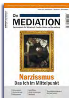
Ausgabe 2 | 2016