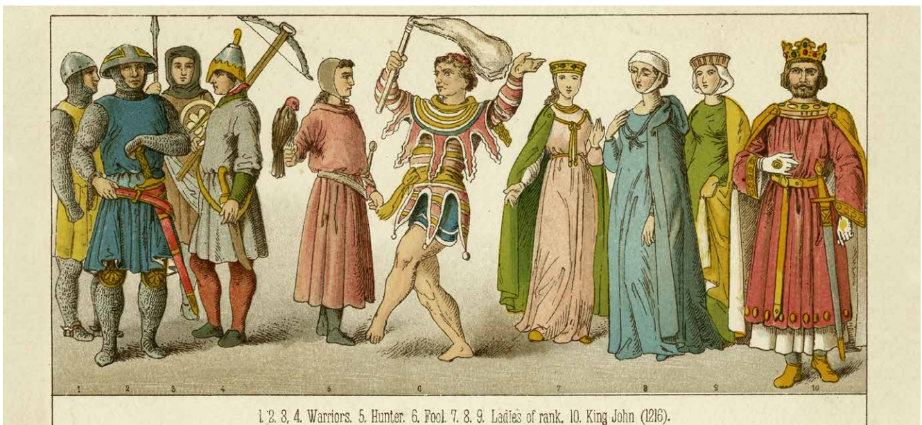
1 2 3 4. Warriors. 5. Hunter. 6. Fool. 7. 8. 9. Ladies of rank. 10. King John (1216).

Der Narr schützt vor dem Verlust der Objektivität, verhindert Selbstüberschätzung und Betriebsblindheit. Besonders bei Shakespeare wird er zu einer reflektierenden, fragenden und komplexen Figur, die wichtige Themen in den Fokus stellt und Missstände anspricht. Seine Kraft bezieht der Narr aus seiner