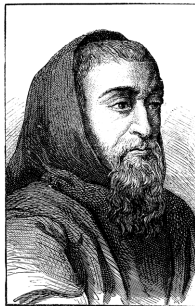
Abb.: Berühmte Ratgeber. Links: Ludovico Ariosto (1474–1533), italienischer Humanist. Als Berater des Herzogs Ercole I. d'Este nahm er 1532 an Verhandlungen mit Kaiser Karl V. teil. Rechts: Père Joseph (1577–1638), Beichtvater Kardinal Richelieus. Auf ihn geht die Redewendung „graue Eminenz“ zurück.